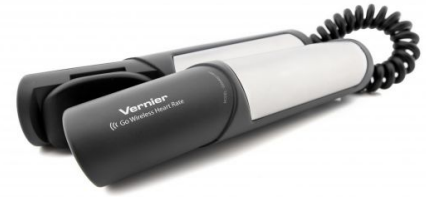
Go Wireless Pulsmesser

Der Go Wireless Pulsmesser besteht aus zwei Griffen, welche zusammen mit einem Mobilgerät die Herzfrequenz eines Probanden messen können. Er eignet sich besonders zur Überwachung der Herzfrequenz vor, während und nach körperlicher Anstrengung. Per Bluetooth können die Messdaten direkt zu einem Smartphone, Tablet, LabQuest 2 und vielen anderen mobilen Endgeräten gesendet werden. Der Vorteil der Handgriffe ist der problemlose Wechsel zur nächsten Person.