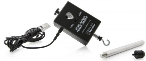
Kraftsensor mit zwei Messbereichen

Der Kraftsensor mit zwei Messbereichen ist ein universeller Sensor zur Ermittlung von Zug- und Druckkräften. Er kann wie ein Ersatz für eine Federwaage in der Hand oder auf einem Ringständer eingesetzt werden. Eine weitere Montageart ist auf einem Schlittenwagen für die Untersuchung von Kollisionen. Mit diesem Kraftsensor können Kräfte von 0,01 N bis zu 50 N gemessen werden.