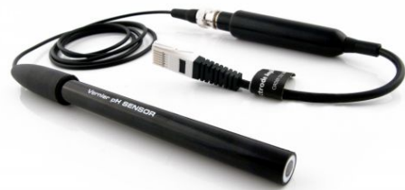
pH-Sensor mit flacher Elektrode

Der Sensor misst den pH-Wert einer Lösung oder einer halbfesten Masse. Die Glasmembran ist nicht abgerundet, sondern flach, dadurch ist sie einfacher zu reinigen und strapazierfähiger. Die flache Membran ermöglicht Messungen auf ebenen Oberflächen sowie bei kleineren Probengrößen. Eine abgedichtete mit Gel gefüllte Doppelkammer-Elektrode ermöglicht Kompatibilität zu Tris-Puffern und Lösungen, die Proteine und Sulfide erhalten. Der mitgelieferte Elektrodenverstärker speichert eine benutzerdefinierte Kalibrierung.